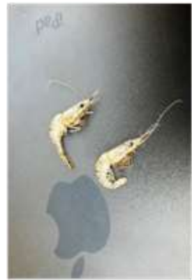
側溝にいた生きているエビ